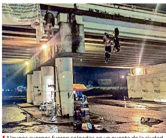
Algunos cuerpos fueron colgados en un puente de la ciudad.