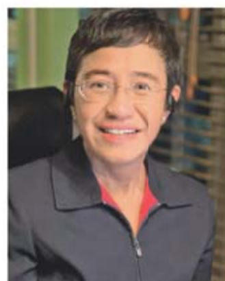
María Ressa ha destapado escándalos en torno a Duterte.

del medio ruso Novaya Gazeta han sido asesinados, incluida Anna Politkovskaya