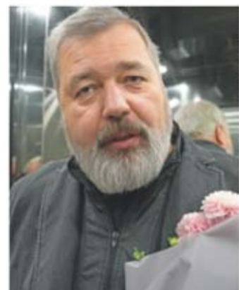
Dmitry Muratov cofundó un diario crítico del gobierno ruso.

APLICAN CÓDIGO EN CONACYT PARA CENSURAR A PERSONAL