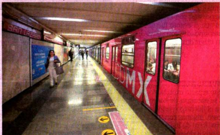
El Metro de la Ciudad de México tuvo una muy baja afluencia de pasajeros debido a la ausencia de mujeres.

Estaban todavía esos nombres, escritos como si fueran