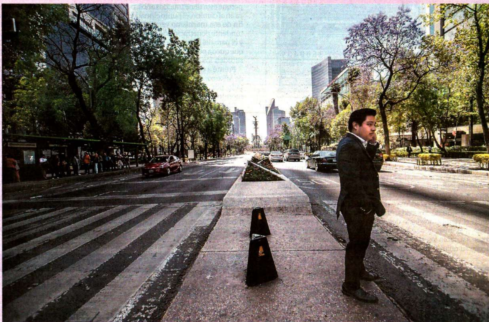
Así lució el Paseo de la Reforma la tarde de ayer, en un punto que suele ser sumamente concurrido por la cercana ubicación de oficinas y comercios. En la capital y en diversas ciudades del país la ausencia de mujeres por el paro fue más que notoria.