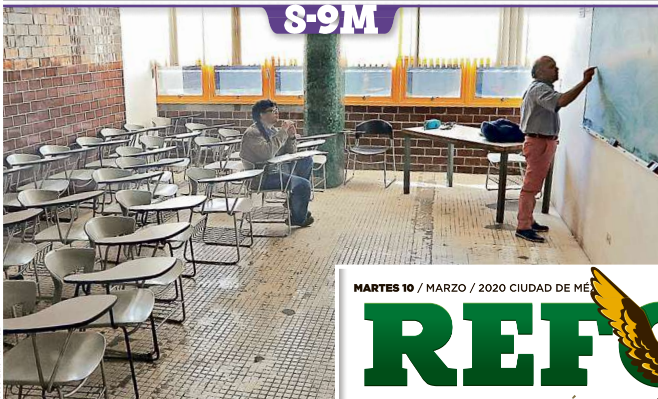
Un salón de la Facultad de Química de la UNAM contó solo con un alumno por el paro de mujeres.