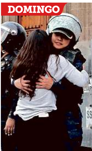
De mujer a mujer.

“Le respondí que estábamos para servirle. Agarré fuerzas, y el abrazo me dio aliento y motivación a ser mejor”, cuenta.