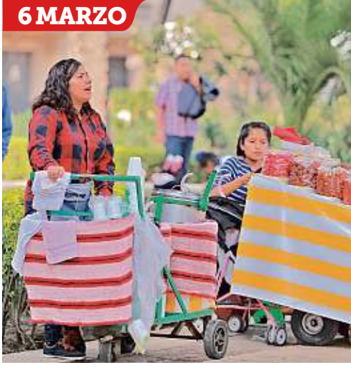
Una vendedora de nieves atendió la convocatoria a #UnDíaSinNosotras por lo que su papá se hizo cargo del negocio que tienen en Reforma a la altura de la Torre Mayor.