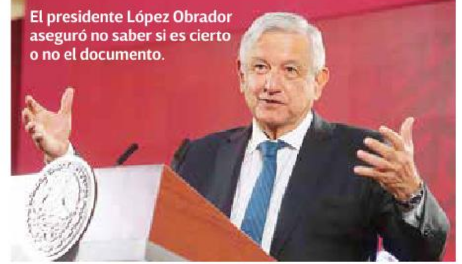
El presidente López Obrador aseguró no saber si es cierto o no el documento.