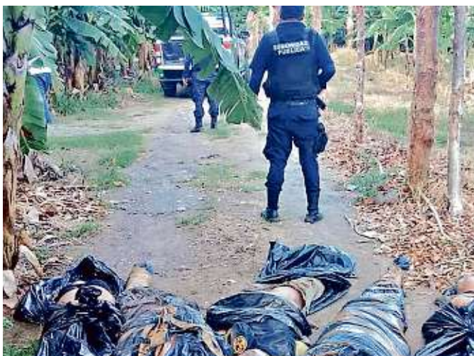
El jueves la violencia fue en la zona centro y ayer en el norte.