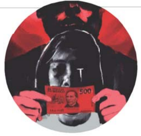
DANTE DE LA VEGA. EL UNIVERSAL

Sus empleadores evitan las denuncias y amenazan con no volver a contratarlas. La inacción de las autoridades de la industria hotelera y el aumento del crimen organizado han derivado en que camaristas y meseras pasen por situaciones de acoso, intentos de proxenetismo y violaciones, tanto a manos de compañeros de trabajo como de huéspedes, hasta llegar a feminicidios. La violencia contra las trabaja-