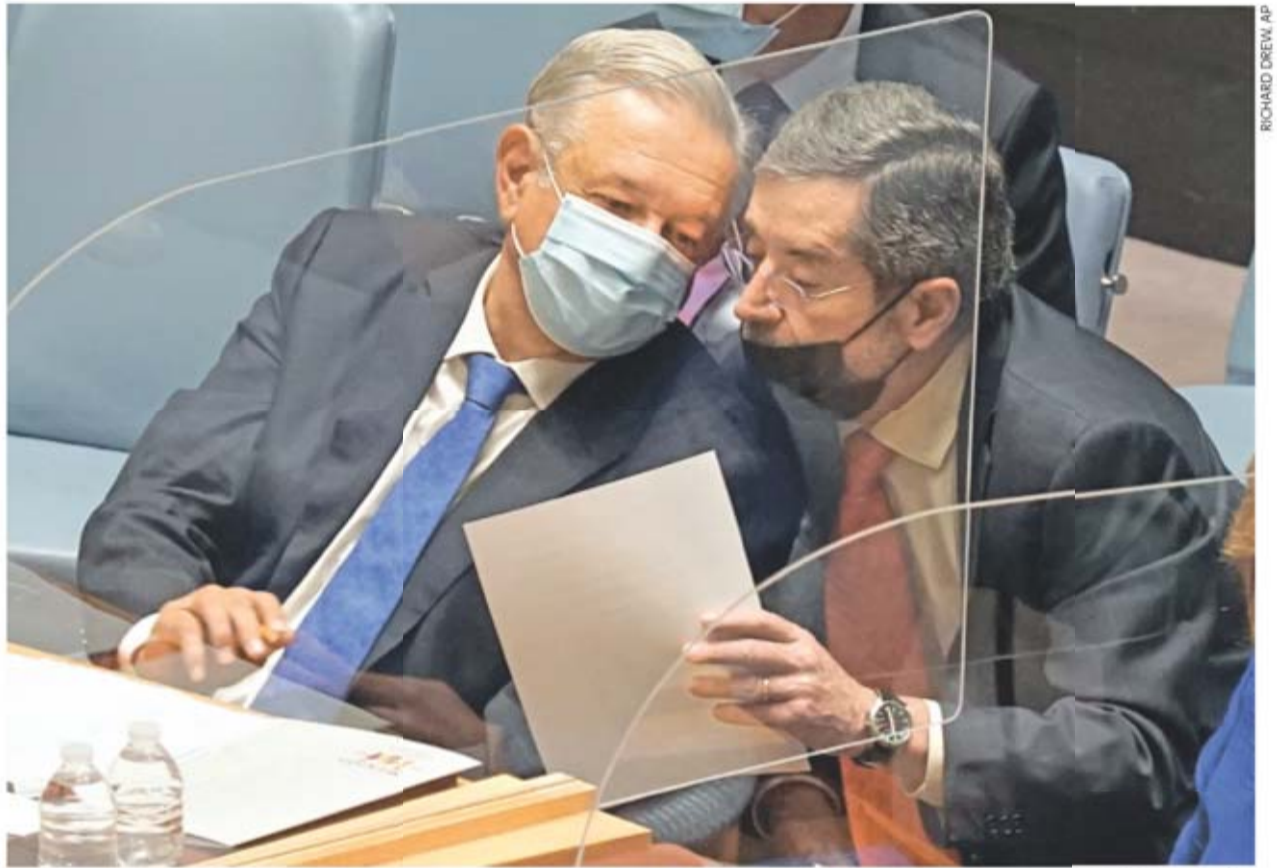
El presidente Andrés Manuel López Obrador estuvo acompañado por Juan Ramón de la Fuente, embajador de México ante la ONU, en la sesión del Consejo de Seguridad, donde retomó su lema de campaña: "Por el bien de todos, primero los pobres".