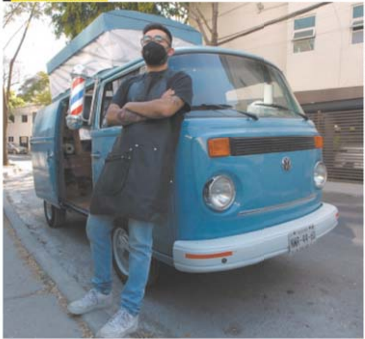
HUMBERTO MORALES. EL UNIVERSAL