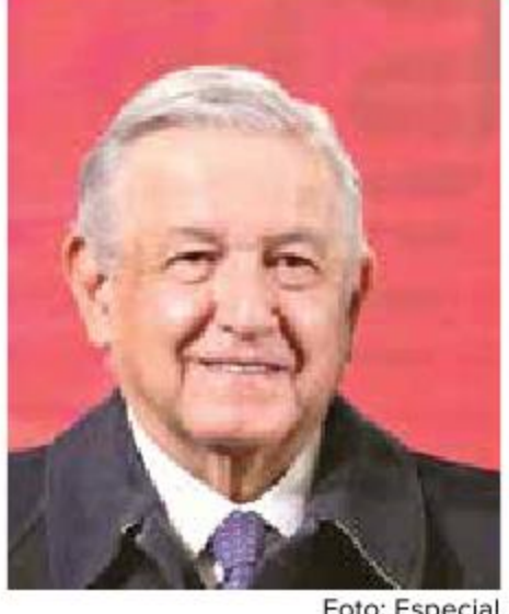
El presidente López Obrador.

El gobierno federal, obreros y empresarios pactaron mejorar la iniciativa que busca regular el outsourcing y castigar prácticas abusivas de este esquema de contratación laboral.