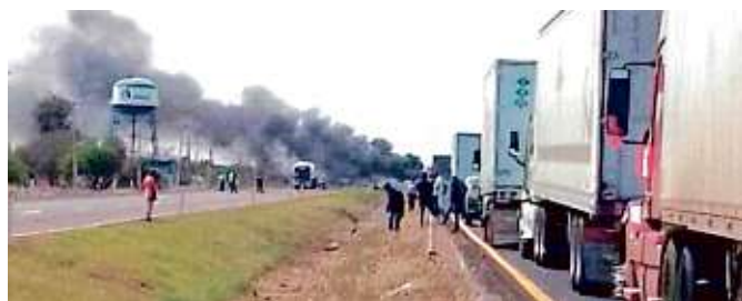
Al menos cuatro accesos o salidas de Celaya sufrieron quema de vehículos o bloqueos con camiones pesados.

La autopista Salamanca-Celaya y otras vialidades estatales fueron blanco de presuntos integrantes del Cártel Santa Rosa de Lima que ade-