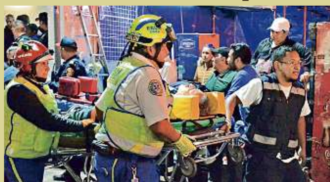
Los heridos fueron trasladados a dos hospitales. Un hombre permanecía prensado.

Repentinamente cerró sus puertas y de inmediato volvió a abrirlas; el convoy