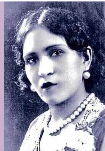
Archivo María Izquierdo / Acervo Museo de Arte Moderno

El Museo Mural Diego Rivera inaugura un programa de género con la exposición individual de la pintora María Izquierdo, cuya obra destacó en los años 30. CULTURA (PÁGINA 14)