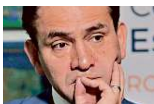
Arturo Herrera, Secretario de Hacienda.

"Nada importa más que ver plasmados los programas en nuestra Carta Magna y con ello constitucionalizar el clientelismo, y eso de ninguna manera lo vamos a validar. Pone de manifiesta la estrategia del Presidente, de elevar a rango constitucional su visión populista de Gobierno", acusó el panista.