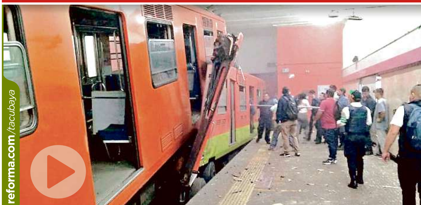
El tren impactado, que estaba completamente apagado, retrocedió unos 8 metros.

El diputado Porfirio Muñoz Ledo calificó de hipócritas y lambiscones a los diputados de Morena, al reclamar que no le aprobaron una reserva de ley y luego le dijeron que sí la habían apoyado. PÁG. 10