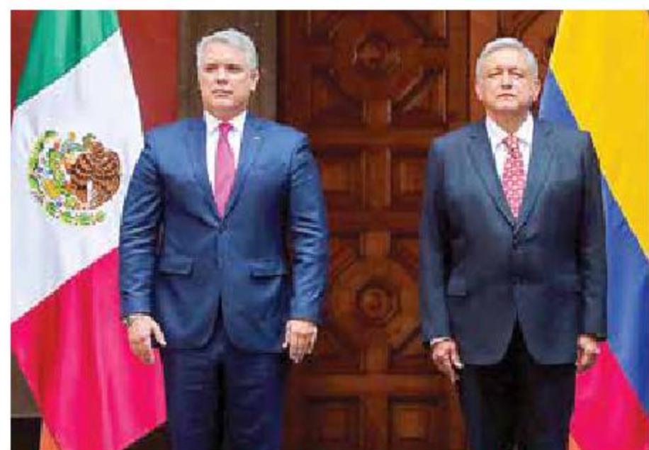
LÓPEZ OBRADOR RECIBE A IVÁN DUQUE