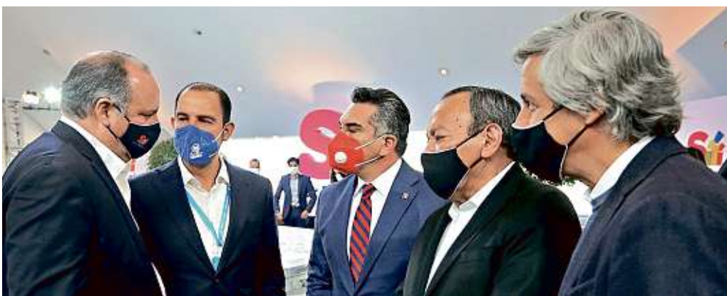
OPPOSITORES. Gustavo de Hoyos, presidente de Coparmex, con Marko Cortés, Alejandro Moreno y Jesús Zambrano, líderes del PAN, PRI y PRD, respectivamente, y Claudio X. González Guajardo, quien también asistió a la convención de Sí por México.

una reunión con el propio Gobernador, encabezada por el Presidente Andrés Manuel López Obrador, el director de la CFE aseguró que el amago de una demanda le provoca risa, descartó responsabilidad de la empresa y consideró que algunos buscan echar culpas a otros para ocultar "torpezas". "Ninguna (responsabilidad), hay gente que anda buscando a ver a quién le echa la culpa de sus torpezas, es todo lo que voy a decir", dijo Bartlett, tras el encuentro en Palacio Nacional.