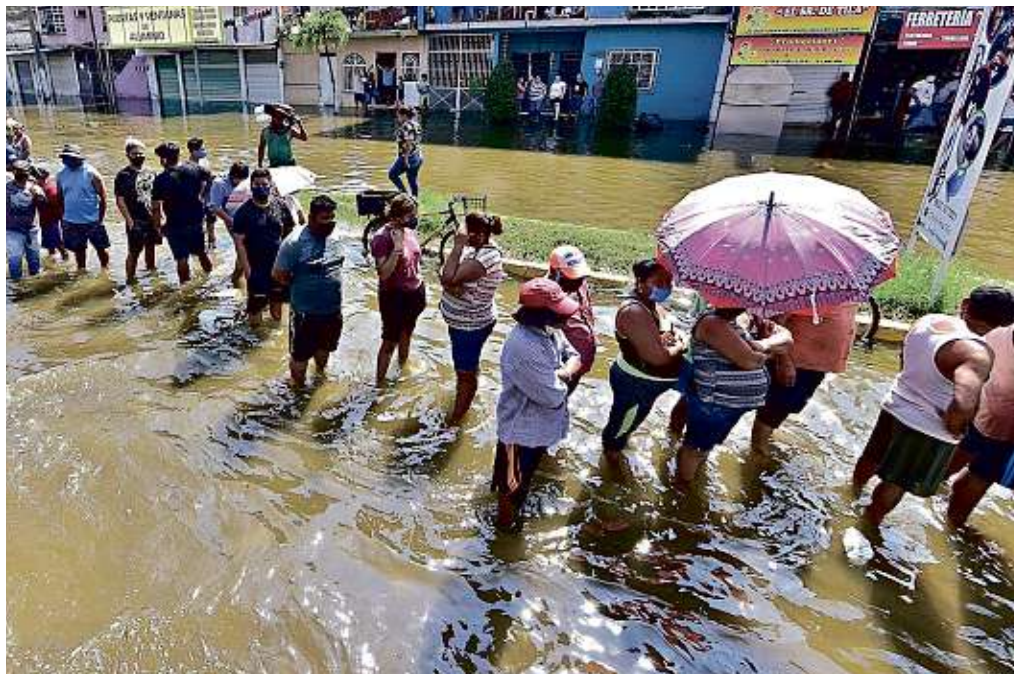
En una calle anegada de Villahermosa, damnificados hacían fila ayer para recibir despensas.