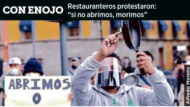
CON ENOJO Restauranteros protestaron: "si no abrimos, morimos"