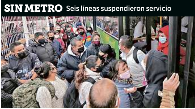
SIN METRO Seis líneas suspendieron servicio

El segundo lunes del año marcó a una Ciudad al límite en su movilidad, reclamos, inseguridad y en crisis hospitalaria.