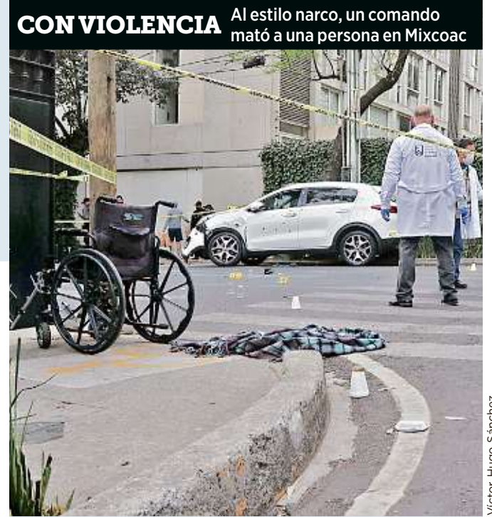
CON VIOLENCIA Al estilo narco, un comando mató a una persona en Mixcoac

MARTES 12 / ENERO / 2021 CIUDAD DE MÉXICO 48 PÁGINAS, AÑO XXVIII NÚMERO 9,872 $ 20.00