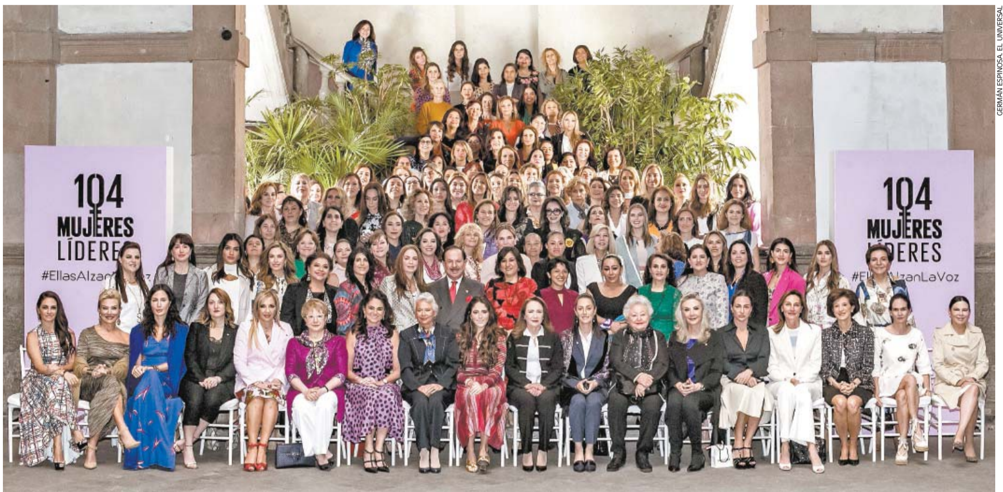
Este diario reunió ayer a mujeres destacadas en todos los ámbitos para compartir sus experiencias y sumarse al llamado contra la violencia de género y la inequidad en el país.

● Pide cumplir la demanda de castigo a quien agrede, viole o mate a una mujer