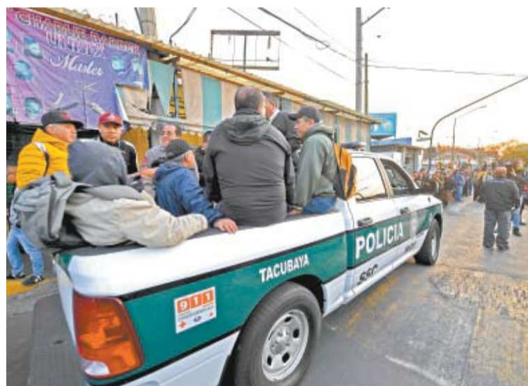
Con vehículos de la policía se trasladó a pasajeros en Juanacatlán, Tacubaya y Observatorio, estaciones cerradas tras el accidente. A19

● Virus pone al deporte mundial a la defensiva. B1