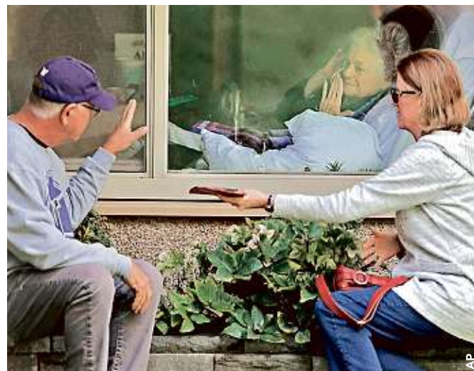
Una mujer infectada con el Covid-19 es visitada por sus familiares en un hospital de Estados Unidos.