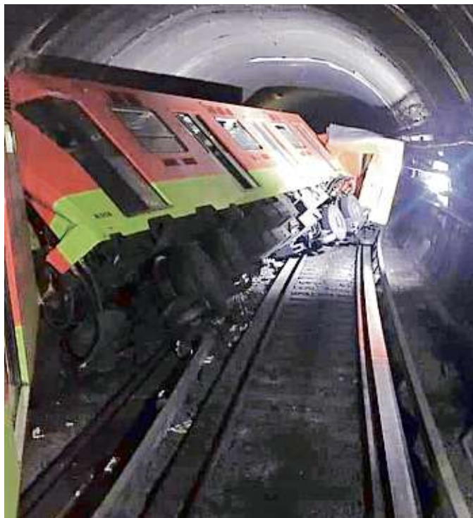
Así quedó el tren que impactó al convoy estacionado en la terminal del metro Tacubaya.