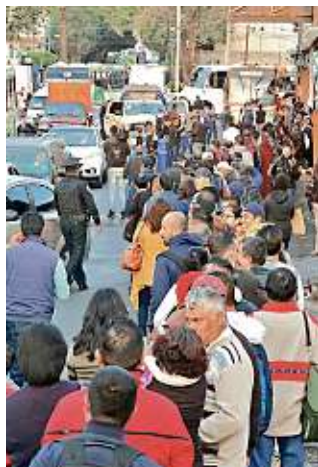
El servicio de transporte se vio rebasado por momentos.

De acuerdo con testimonio de usuarios, el tren co-