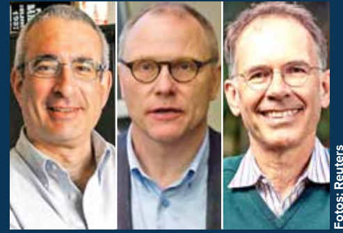
Joshua Angrist David Card Guido Imbens

David Card, Joshua Angrist y Guido Imbens recibieron el Nobel de Economía 2021 por sus contribuciones empíricas a la economía laboral y a las relaciones causales.