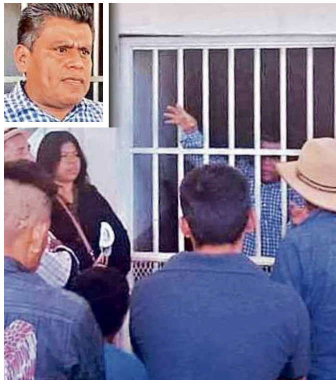
El Alcalde de Morena estuvo encerrado casi cuatro horas.