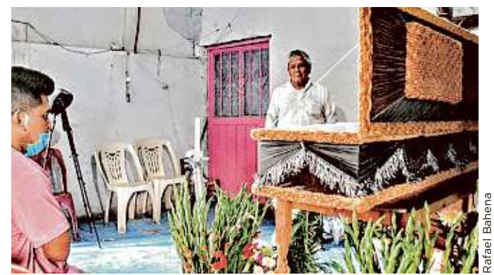
Al menos 9 personas en Telixtác, Morelos, murieron por consumir alcohol adulterado, una de ellas fue velada ayer.

La escasez de cerveza, debido a que la industria paró la producción al ser declarada no esencial, también favoreció el consumo de vinos y licores, que sin embargo están restringidos por algunas autoridades locales.