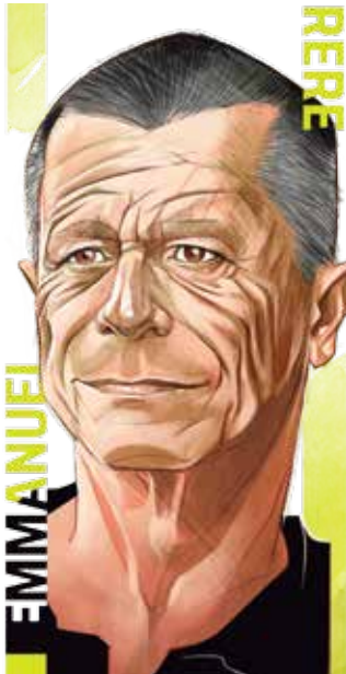
Ilustración: Horacio Sierra

En entrevista exclusiva con Grupo Imagen , el francés, ganador del Premio Princesa de Asturias de las Letras 2021, habla de la depresión que sufrió y cómo el yoga permea su vida. "La poesía puede ser un veneno y un remedio", remata el escritor. / 22