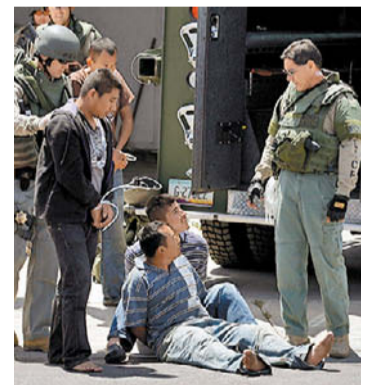
Persecución de la migra . AP

El secretario de Seguridad Nacional de EU plantea ir contra patrones por bajos salarios y jornadas extenuantes. PAG. 12