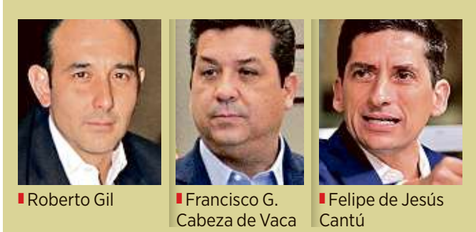
Roberto Gil, Francisco G. Cabeza de Vaca, Felipe de Jesús Cantú