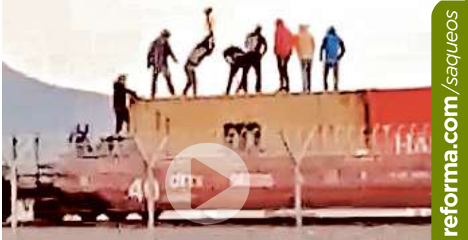
Con mazos y picos, hasta 150 personas suben a romper las puertas de los vagones para saquearlos.

Cobran cuota a transportistas Conductores de las rutas 13 y 14, de Iztapalapa y Coyoacán, acusaron que son obligados a pagar hasta 200 pesos por unidad a supuestos integrantes del Sindicato Libertad. CIUDAD