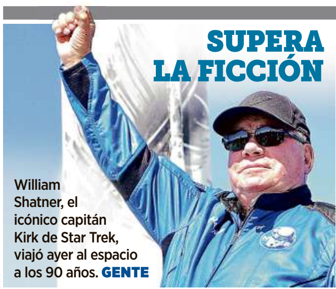
William Shatner, el icónico capitán Kirk de Star Trek, viajó ayer al espacio a los 90 años. GENTE