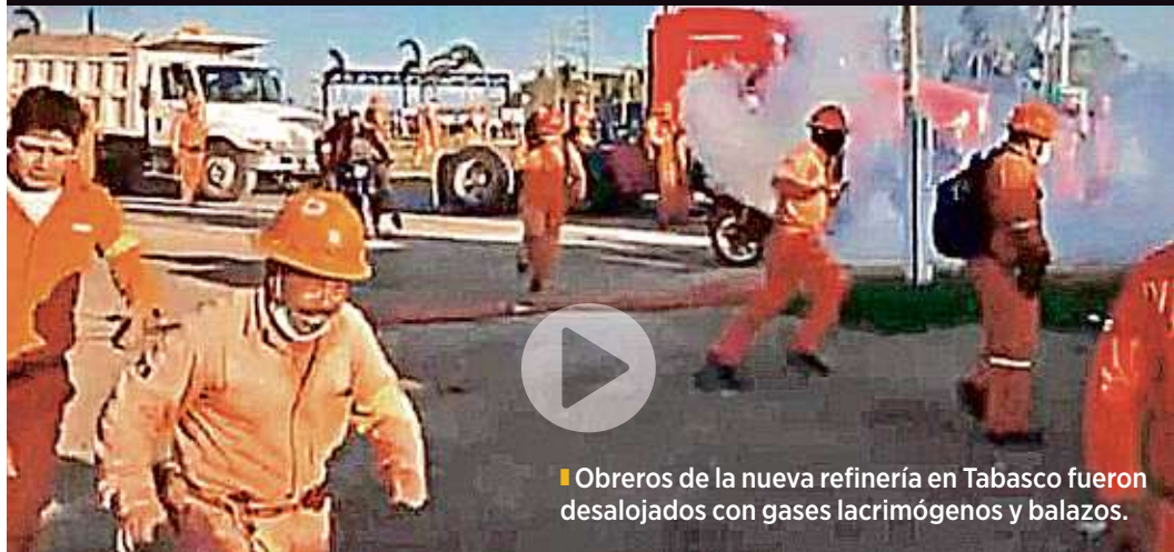
Obreros de la nueva refinería en Tabasco fueron desalojados con gases lacrimógenos y balazos.