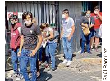
En Veracruz más de 400 menores que se ampararon, ayer fueron vacunados.

"Ayer nos negaron el acceso a los que no tienen credencial de la ICA, llevamos 7 meses laborando y no nos han entregado nuestra credencial; al no entregar credencial, la gente empezó a alborotarse. Los que estamos en paro somos muchos, mucha gente viene de otros lados y no les importa ganar una miseria, que es lo que nos pagan", narró a REFORMA uno de los empleados que ayer fueron desalojados.