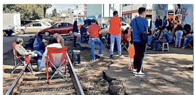
Desde hace 2 meses maestros de la CNTE bloquean las vías del tren en diferentes puntos de Michoacán.

Aunque la ley establece que se trata de vías federales,