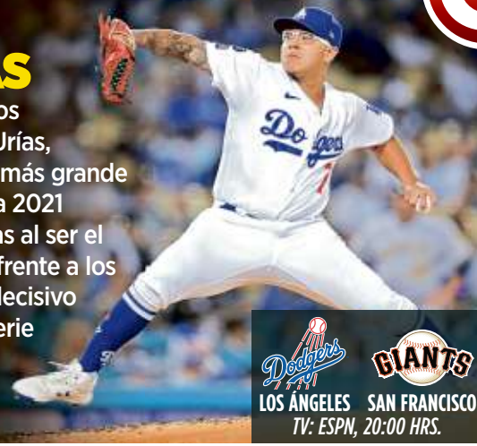
LOS ANGELES DODGERS vs SAN FRANCISCO GIANTS TV: ESPN, 20:00 HRS.

El lanzador de los Dodgers, Julio Urías, enfrenta el reto más grande de la temporada 2021 de Grandes Ligas al ser el pitcher abridor frente a los Gigantes en el decisivo Juego 5 de la Serie Divisional de la Liga Nacional.