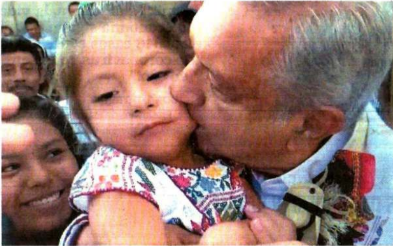
Ante la pandemia de Covid-19, usuarios de redes sociales criticaron que el presidente López Obrador repartiera besos durante su gira por Guerrero.