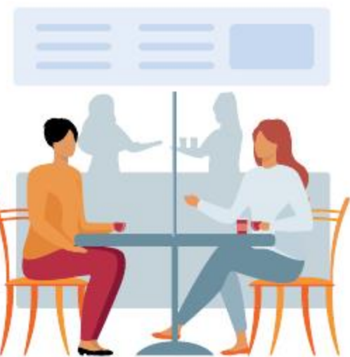
Ilustración: Jesús Sánchez