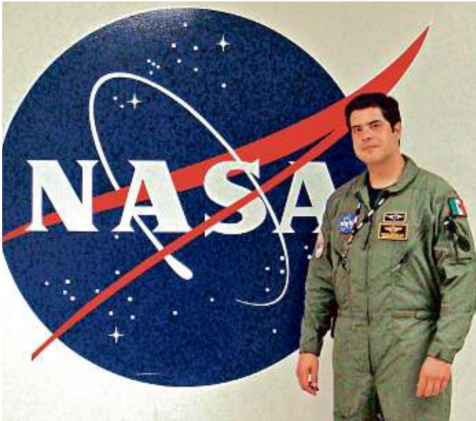
Cortésia: Carlos Salicrup