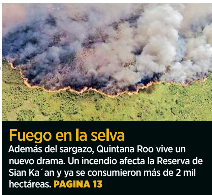
Además del sargazo, Quintana Roo vive un nuevo drama. Un incendio afecta la Reserva de Sian Ka'an y ya se consumieron más de 2 mil hectáreas. PAGINA 13

La renuncia de Carlos Urzúa a la Secretaría de Hacienda el martes pasado dañó más la tambaleante confianza empresarial en México y exhibió los riesgos del Gobierno de Andrés Manuel López Obrador para el País, señaló ayer un artículo editorial de The Wall Street Journal (WSJ).