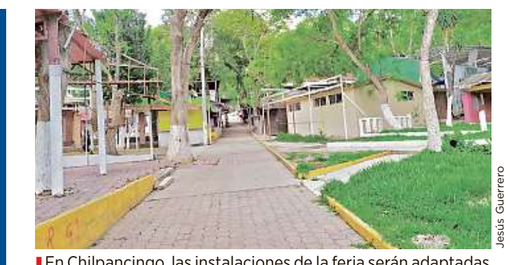
En Chilpancingo, las instalaciones de la feria serán adaptadas para albergar a la Guardia Nacional.