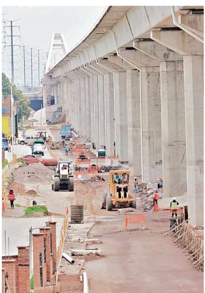
Originalmente el tren estaría listo en el 2017, pero ahora se contempla que será concluido en el 2020.