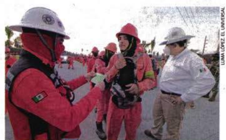
Los trabajadores de ICA Fluor regresaron ayer a sus labores. Para ingresar tuvieron que formarse y se les revisó la mochila.