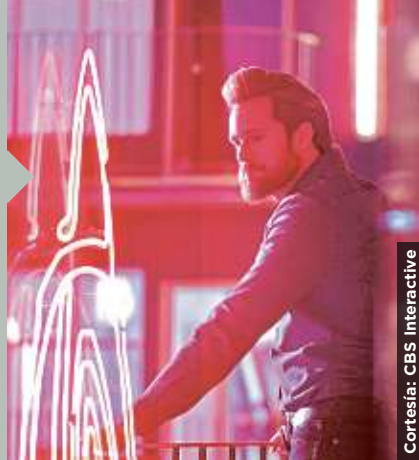
Cortés: CBS Interactive