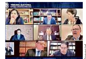
Los magistrados del Trife en sesión virtual.

"Y que esto sea acorde con lo que hoy se ha discutido en esta sesión y que consta en las versiones estenográficas", señaló el Magistrado