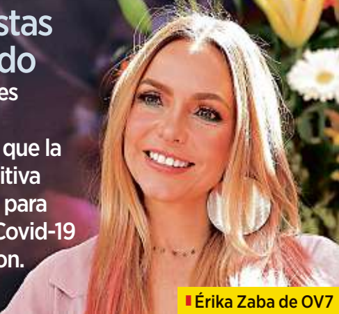
■ Erika Zaba de OV7

Optimistas ante todo Celebridades mexicanas comparten que la actitud positiva fue la clave para superar el Covid-19 que sufrieron.