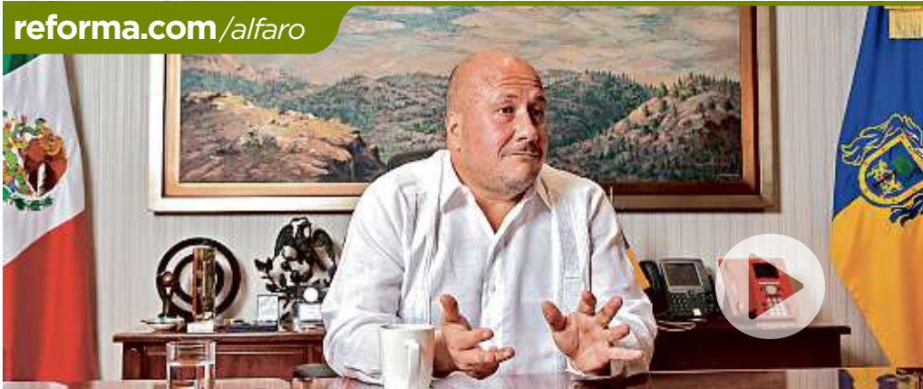
Alfaro confió en que los Gobernadores logren reconfigurar un nuevo espacio de coordinación.