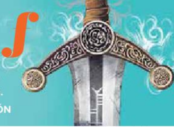
Ilustración: Horacio Sierra