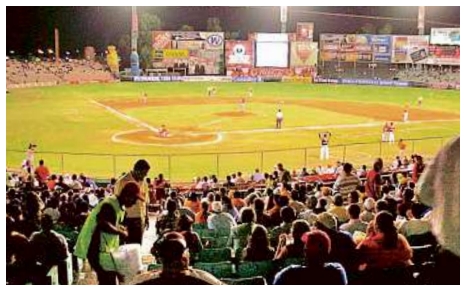
El estadio Héctor Espino, era casa de los Naranjeros.

de insumos y de condiciones para hacer su trabajo; y cuando tienes enfrente una crisis económica, cualquier compromiso de esta naturaleza que no genera absolutamente nada, debería frenarse”, reprochó el senador Clemente Castañeda, líder nacional de Movimiento Ciudadano (MC)