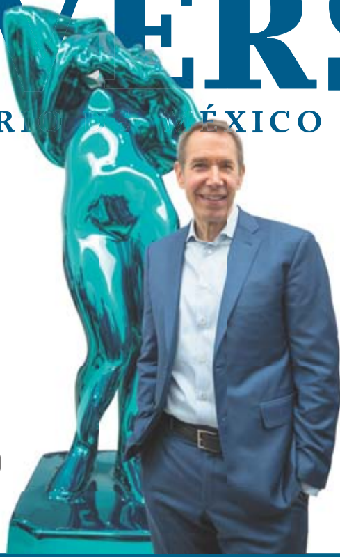
SERGIO TAPIA, EL UNIVERSAL

EL ARTISTA HABLA DE LA EXPOSICIÓN APARIENCIA DESNUDA, QUE ABRE AL PÚBLICO EL 19 DE MAYO EN EL MUSEO JUMEX. C12