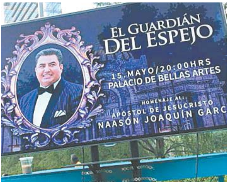
En espectaculares se anunció la gala de ópera El Guardián del Espejo en Bellas Artes como un homenaje para el líder de La Luz del Mundo.