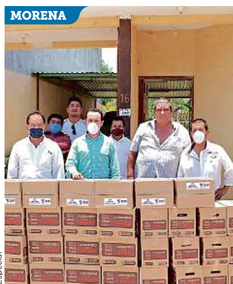
EN REDES. En el Edomex, un operador morenista presumió la entrega de apoyos a nombre de Horacio Duarte, mientras en Sonora, la senadora Sylvana Beltrones, y en Querétaro, Mauricio Kuri, hicieron lo propio.