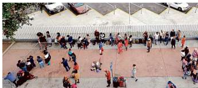
■ Migrantes esperaban ayer ser atendidos en Tijuana.