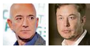
Jeff Bezos Elon Musk

El viernes, Blue Origin cuestionó el módulo lunar Starship HLS, de SpaceX, al asegurar