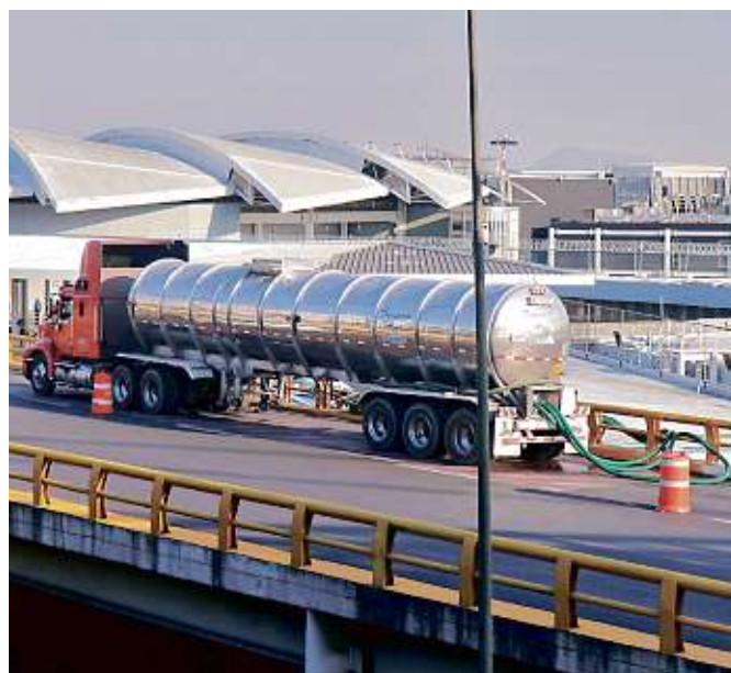
El servicio de agua al AICM, surtido de manera irregular por la empresa Servicio Trejo Pipas de Agua, mantuvo ayer su operación sin ningún problema. A diario surte en promedio 38 cargas a la terminal aérea.