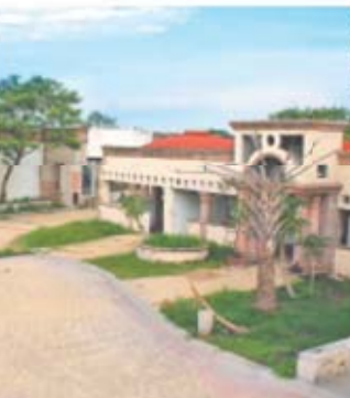
El Paraíso, de 2.5 hectáreas, e fue decomisado al narcotraficante La Barbie.

Pobladores de Atlacholaya, en Xochitepec, municipio de Morelos, lamentaron que el gobierno federal rifará el próximo 15 de septiembre el rancho El Paraíso —decomisado al narcotraficante Edgar Valdez Villarreal, La Barbie—, a pesar de que habían solicitado al presidente Andrés Manuel López Obrador que el inmueble les fuera donado para construir una escuela. Dijeron que buscarán una au-