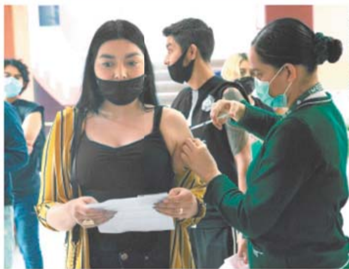
AMEE MELO, EL UNIVERSAL

Tijuana.— Por primera vez en las largas filas para la vacunación contra Covid-19 se observaron jóvenes, debido a que en Baja California arrancó la inmunización masiva para mayores de 18 años. Durante 10 días en la entidad se aplicarán un millón 350 mil dosis de la vacuna Johnson & Johnson, de una sola aplicación, donadas por Estados Unidos. | ESTADOS | A12