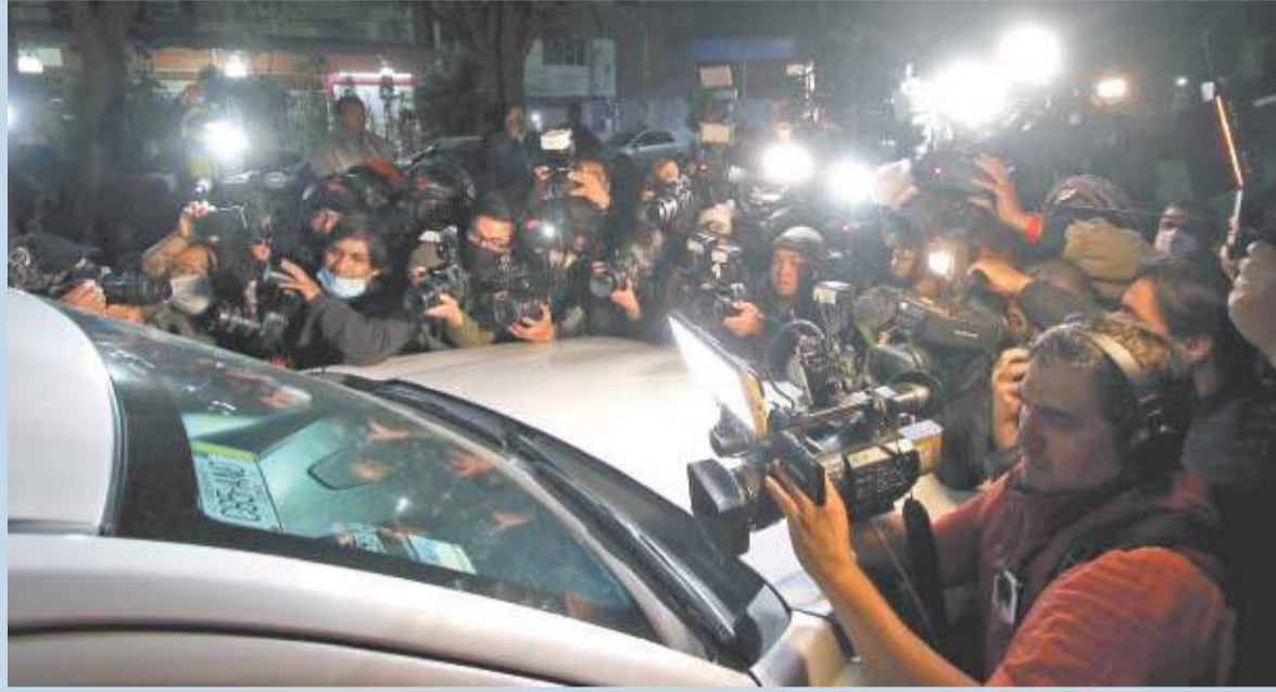
Con cámaras fotográficas y de video, periodistas se abalanzaron sobre el convoy para ubicar al exfuncionario.