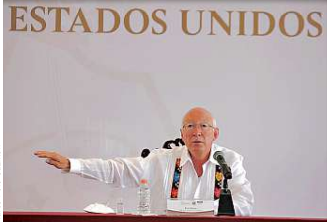
De visita en Tabasco, el Embajador de EU en México pidió enfocarse en lo que ambos países pueden hacer juntos.

Racha atlista Con un 3-0 como visitante, el Atlas superó al Necaxa y ligó cinco partidos sin derrota en los que ha obtenido 9 puntos de 15 disputados. CANCHA