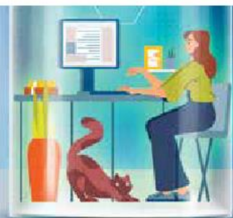
Arte: Jesús Sánchez

La pandemia aceleró la necesidad de crear entornos de trabajo más seguros ante el embate de los cibercriminales, por lo que las empresas están adoptando nuevas tecnologías y procuran capacitar a sus empleados. / 20