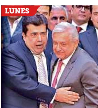
El líder de la CATEM mostró el lunes a AMLO el "músculo" de esa central.