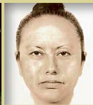
La sospechosa habría compartido casa con la familia de Fátima. El domicilio de la mujer fue cateado ayer.