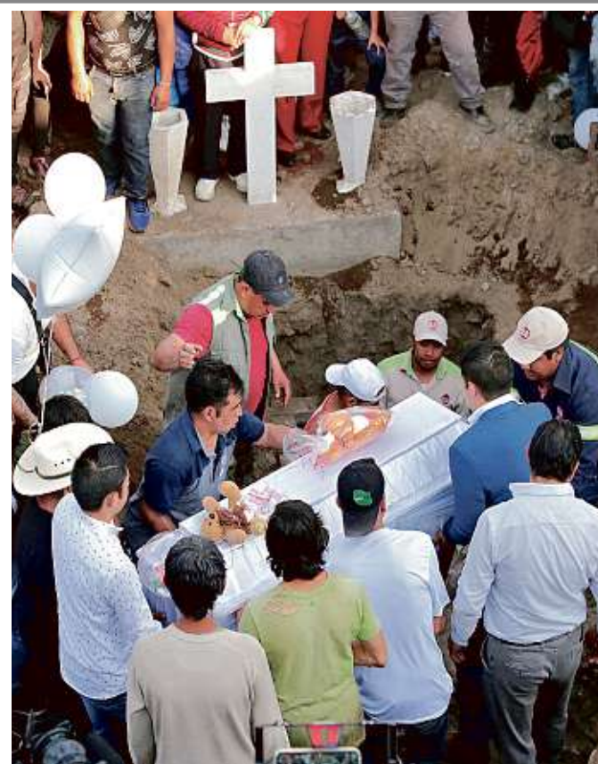
Antes de sepultarlo, el cuerpo de la niña fue llevado a su escuela. Más de 200 personas acompañaron el cortejo.

Autor de desnudos que lleva al bronce o al mármol, con reminiscencias a la Grecia clásica, el británico Stuart Sandford prepara un proyecto para México. CULTURA (PÁG. 17)