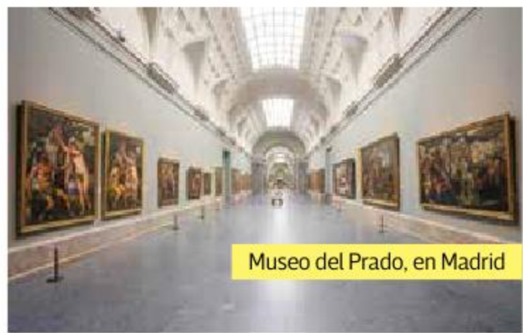
Museo del Prado, en Madrid