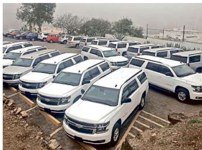
En 2017, la Corte compró 70 camionetas blindadas (la última y más numerosa) y fue para jueces de la Ciudad de México, Toluca, Zapopan y Monterrey (foto).