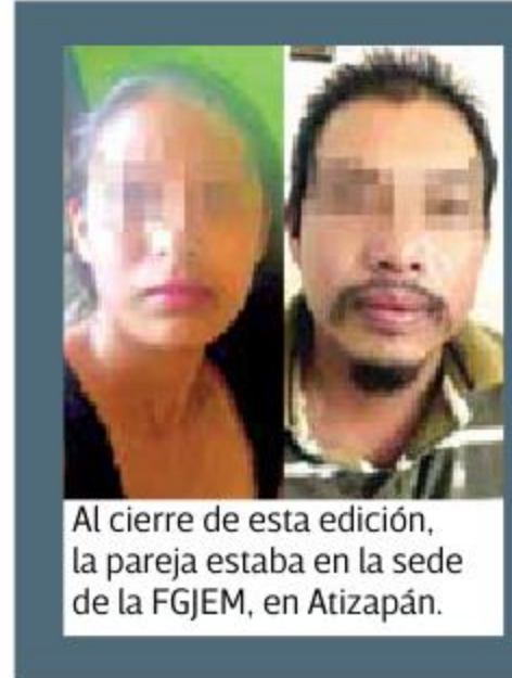
Al cierre de esta edición, la pareja estaba en la sede de la FJEM, en Atizapán.