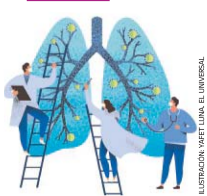
ILUSTRACIÓN: YAFET LUNA. EL UNIVERSAL