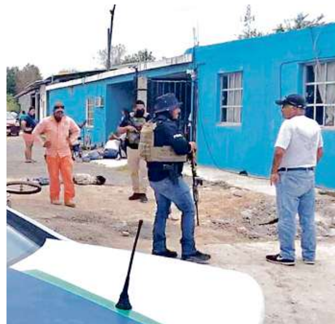
Afuera de una casa de la Colonia Almaguer, de Reynosa, el comando habría ejecutado a siete de las 14 personas.