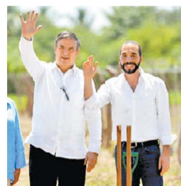
El canciller.