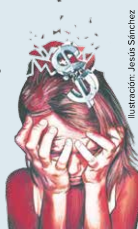
Ilustración: Jesús Sánchez