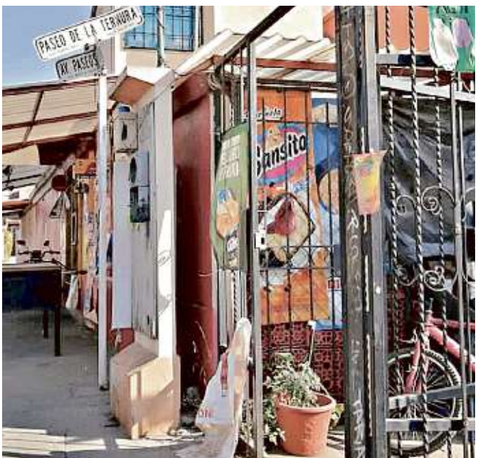
■ La “empresa” a la que Ecatepec supuestamente le compró 400 cámaras de seguridad, es una miscelánea en Chalco.

Pero con Pireo adquirió sólo 400 cámaras según el contrato MEM-DA-DSPyT-AD-RP-05-2020-04 en el punto 8.1 de las obligaciones de El Proveedor.