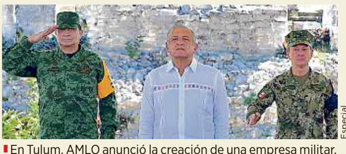
■ En Tulum, AMLO anunció la creación de una empresa militar.

“Que sea autosuficiente y que las utilidades de esta empresa se destinen a fortalecer las finanzas para pensionados y jubilados de las Fuerzas Armadas, tanto de la Secretaría de Marina como de la Secretaría de la Defensa”, agregó el Mandatario.